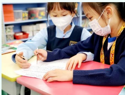
共學-英文課小組共同寫作

在未來的日子，深信劉德的發展只會愈來愈好。最後，祝願每一位家長、孩子都有愉快而充實的聖誕節，並帶着感恩和期望迎接新一年(2022)！