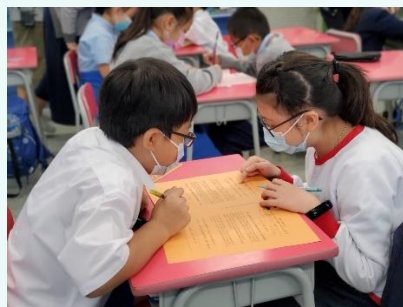
互學-常識課小組互相核對資料