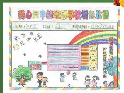
保良局易澤峰幼稚園 優異獎 吳愷澄 (上午高班B)