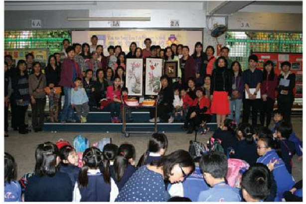
▲ 家長為學校送上祝賀