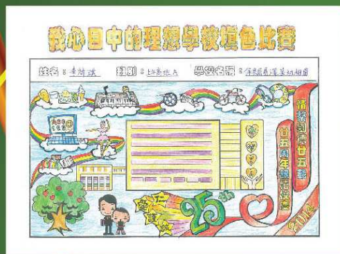
保良局易澤峰幼稚園 冠軍 李焯琪 (上午高班A)