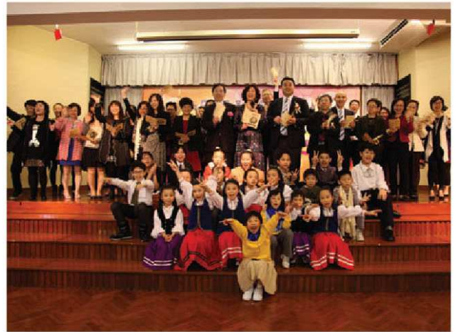
▲ 各嘉賓、老師、家長和學生合唱「自信打不死」