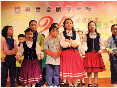
▲ 英文造型朗誦表演