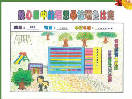
保良局易澤峰幼稚園 優異獎 譚煜曦 (上午低班B)