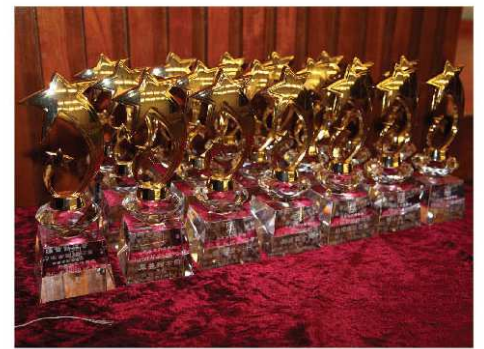
▲ 老斯卡巨星得獎獎座