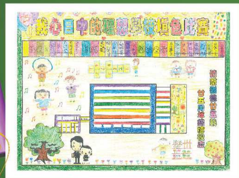
保良局易澤峰幼稚園 季軍 關穎瑜 (上午高班B)