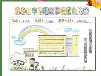
香港浸信會聯會香港西北 扶輪社幼稚園 優異獎 陳諾兒 (全日幼低班)