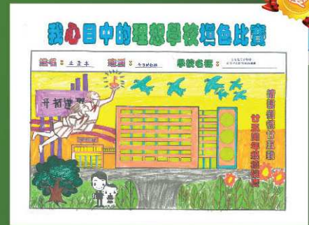
香港浸信會聯會香港西北 扶輪社幼稚園 優異獎 丘景丰 (全日幼仁班)