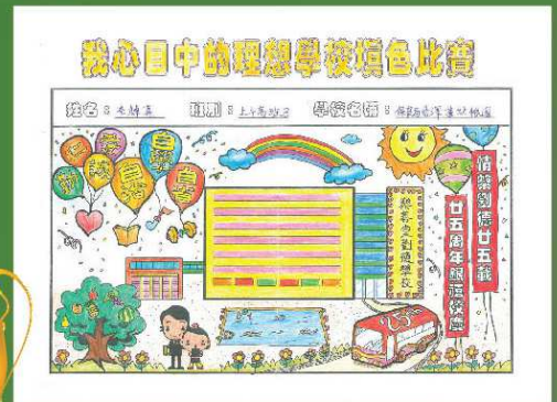
保良局易澤峰幼稚園 亞軍 李焯熹 (上午高班B)