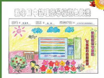
基督教聖約教會司務道 幼稚園 優異獎 張海峰 (低班)