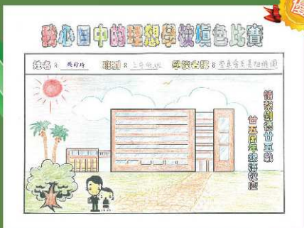
基督教崇真會美善幼稚園 優異獎 吳詩琦 (上午低班)