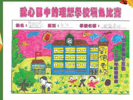
明愛翠林幼兒學校 優異獎 鄭同壹 (K3班)