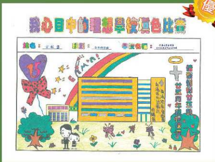
香港浸信會聯會香港西北 扶輪社幼稚園 優異獎 古敏雪 (全日幼信班)