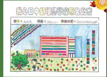
基督教聖約教會司務道 幼稚園 優異獎 張海瞳 (預備班下午班)