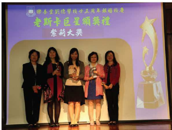
▲ 老斯卡巨星頒獎典禮