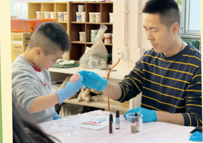
親子酒精水墨畫 體驗工作坊