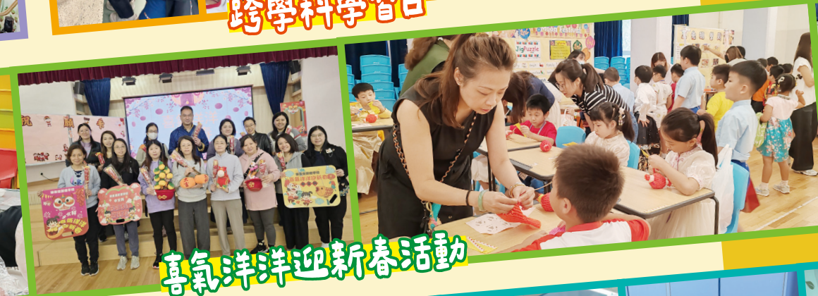
喜氣洋洋迎新春活動