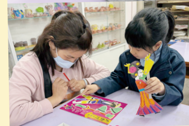
親子中華文化 工作坊